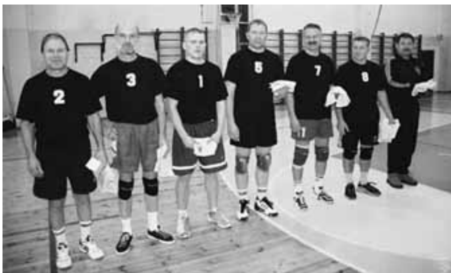
Jüri SK võistkond sõpruskoostumiseks valmis.