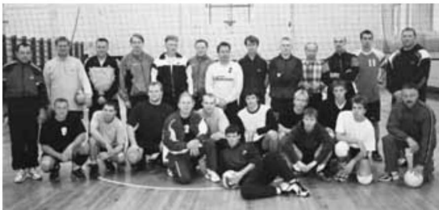
Sõpruskoostumisest osavõtjate ühispilt.