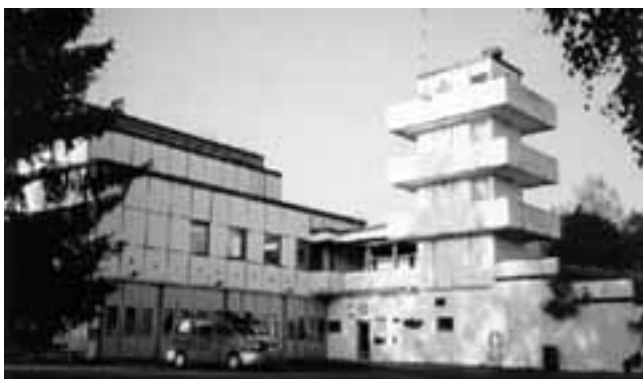
Heinävesi vallamaja, mille alumine korrus on kohaliku tuletõrjekomando käsutuses.