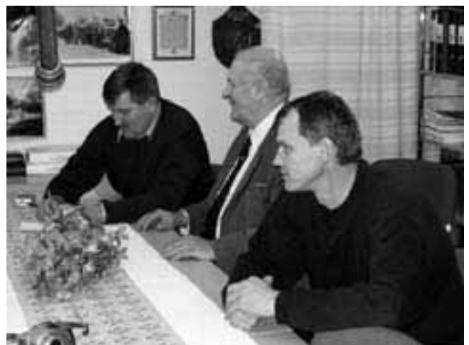
MTÜ Rae TPS-i reisiseltskond.