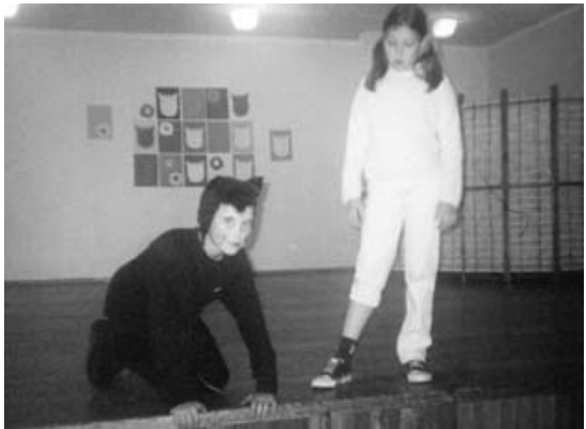
Hetk traditsiooniks kujunenud näitemängupäevast.