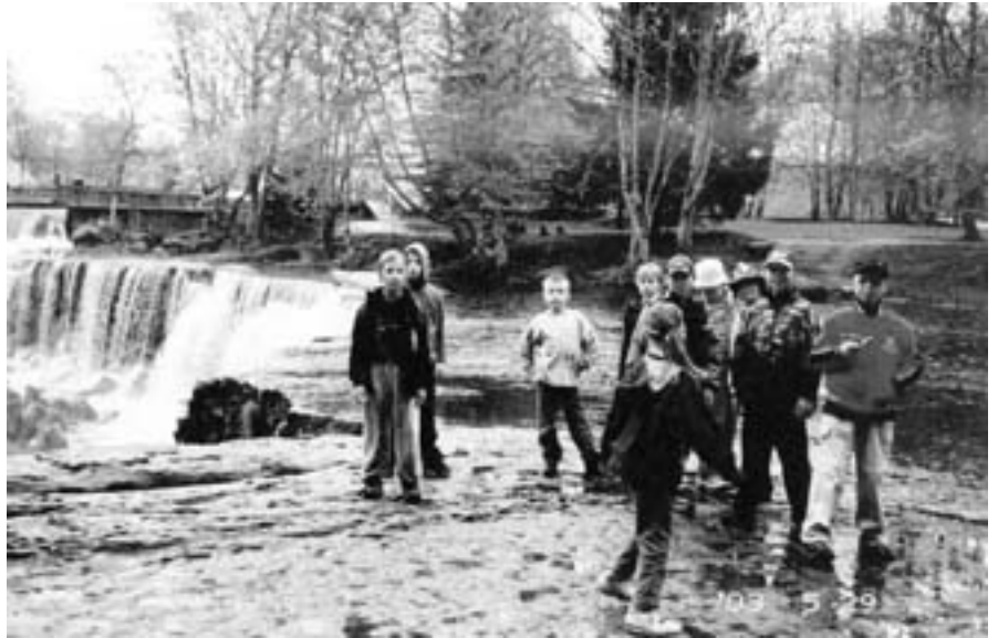
Lehmja Põhikooli algklasside õpilased ekskursioonil Keila-Joal.