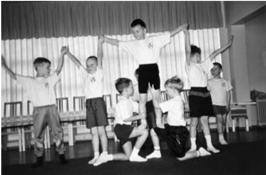
Tõrukese lasteaia poisid võimlemas.

Iga lapsevanem soovib, et tema laps oleks terve ja areneks harmooniliselt. Üheks lapse normaalse arengu näitajaks on hea rüht. Kuid see pole kaasa sündinud, vaid areneb kasvuprotsessis.