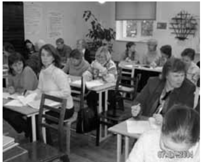
Koolivaheajal istusid koolipinki õpetajad, et täiendada oma ametialaseid teadmisi.