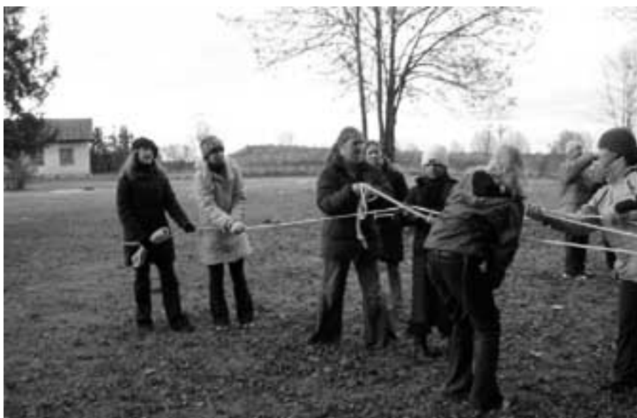
Koostöö patsi punumisel seikluslikul moel.