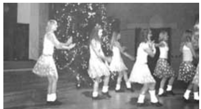
Tantsijad klubist "Red Studio"