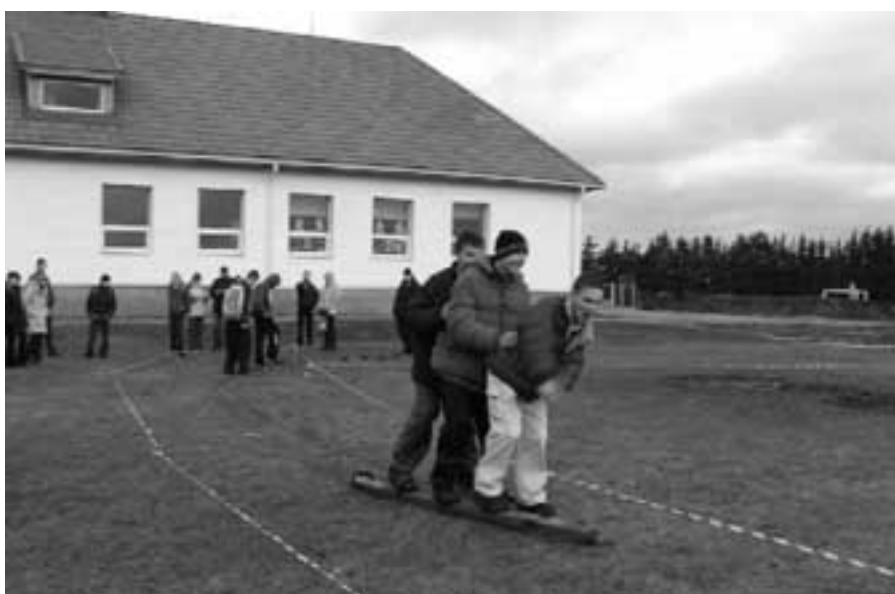
Võidukas meeskond suuskadel finiši poole "lendamas"