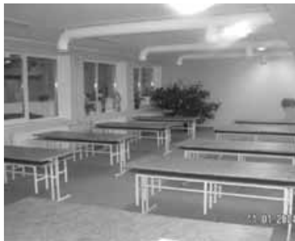
2004. aasta algul lõpetati Lagedi Põhikooli söökla renoveerimistööd.