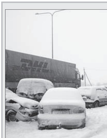
27. veebruaril toimus Pildiküla lähedal Tallinn-Tartu maanteel autode ahelkõppõrge. Eesti väidetavalt suurimas kobarõnnetuses sai kaks inimest kergelt vigastada, õnnetuses osales üle 10 auto.