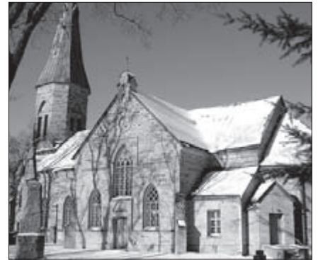
Paljude jaoks võib olla üllatus, et Jüri kirikus on oma väike raamatukogu, mis ootab kõiki lugemishuvilisi.

Milles õieti seisneb kristlik sõnum? Pole ime, et seda alati ei teata. On ju meie hilisajaloos olnud aeg, mil kristlikku trükisõna lausa hävitati. Õnneks on Piibli eesti keelde tõlkimise hällis Jüris lood täna nii, et alevi raamatukogus on võimalik tutvuda koguduse raamatute nimekirjaga, koguduse raamatuid saab siit laenutada