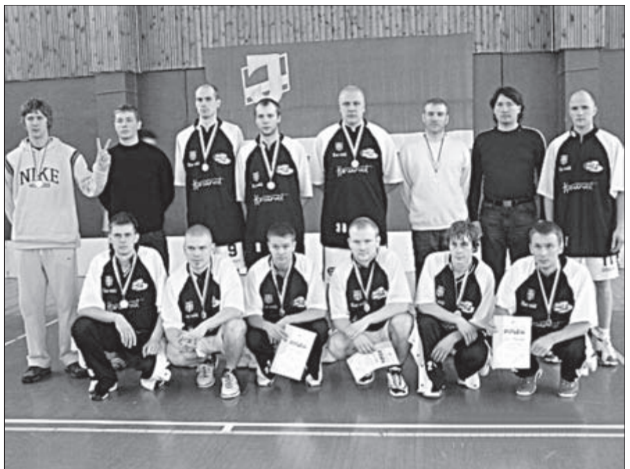
Talimängudel esindasid valda Rae Kossu korvpallurid, kes alustavad märtsikuus play off mängu esiliigas.