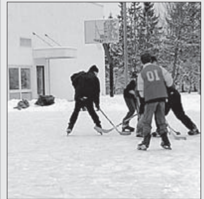
Veebruarikuu algul tegid Rae Tuletõrje- ja Pääseseltsi mehed kingituse Vaida noortele - koolimaja juurde valmistati korralik liiväli.