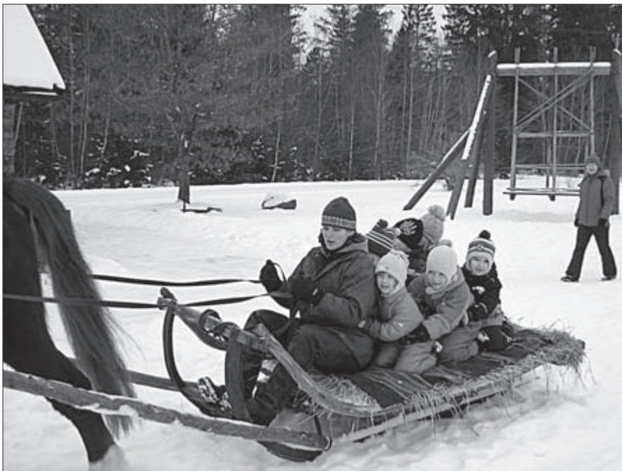
Vastlapäeva kommetega seotud reesõit oli elamuseks nii lastele kui kasvatajatele.

Kaks vanemat rühma käisid vastlapäeva tähistamas Saku vallas Rehemetsa talus. Nii kasvatajatele kui lastele pakkus unustamatu elamuse see, et pererahval oli kogu vastuvõtt peensusteni läbi mõeldud. Lahkelt näidati, kuidas hobuse eest hoolitseda ja kui-