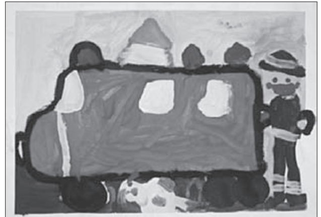
Kristiina Liiv, 5 aastane, Risti lasteaed, Läänemaa

Võistlustööd palume saata hiljemalt 3. aprilliks 2006.a. Harjumaa Päästeteenistusse aadressil Tallinn, Raua 2, 10124. Tööle palume lisada järgnevad andmed: töö autori ees- ja perekonnanimi ning kontaktandmed; klass/rühm ja vanus; kooli/lasteaia nimi ja aadress; juhendaja nimi ja kontakttelefon; aastaarv