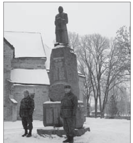
Kirikuaias mälestusmärgi juures olid auvalves kaitseliitlased.

Eesti iseseisvuspäeval, 24. veebruaril aetas vallavanem mälestusküünlad Jüri kalmistul nii endiste vabadusvõitlejate kui valla ajaloo seotud inimeste kalmudele. Kirikuaias, Vabadussõja mälestusmärgi juures meenutati Eesti vabaduse eest võidelnud mehi. Ausamba juures olid auvalves Kaitseliidu Harju maleva Jüri kompanii mehed.