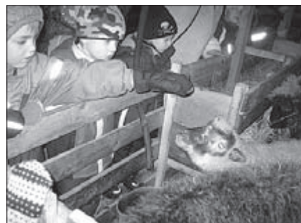
Rehemetsa talus võis lambaid päris lähedalt uudistada.

Eesti Vabariigi 88. aastapäeva tähistati lasteaia saalis tujuküllase kontserdiga ja esmaspäeval, 27. veebruaril külastas lasteaia koolirühm Toompeal riigikogu.