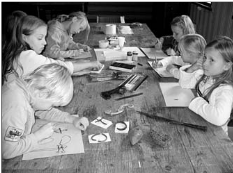
Lapsed said joonistada ja oma kätega meisterdada nii venekirveid, odaotsi kui erinevaid sõlgi.

Töö- ja sõjariistadest said lapsed tutvuda veel nii odaotsa kui kalapüügiahinguga. Mõlemad olid pärit 11.–13. sajandist nagu ka ehted, mis pakkusid erilist huvi ikka tüdrukutele. Pronksist käevõrud ja sõled on tõepoolest kaunistatud nii ilusate mustritega, et neid kannaks uhkelt ka tänapäeval. Varasematel aegadel ei olnud ehted pelgalt iluasjakesed, koostöös folkloristidega on arheoloogid jõudnud veendumusele, et ehetele omistati ka väe- ja