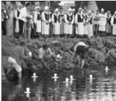
Mariehamnis süüdati mälestusKüünlad Hiroshima pommitamise aastapäeva puhul.