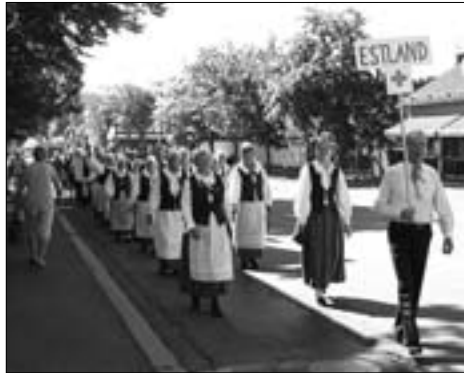
Jüri isetegevuslased osalemas Punase Risti heategevusüritusel.