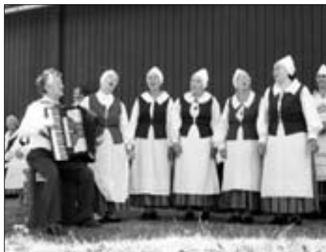
Laulu- ja tantsuansambel Lustilised esinemishoos.