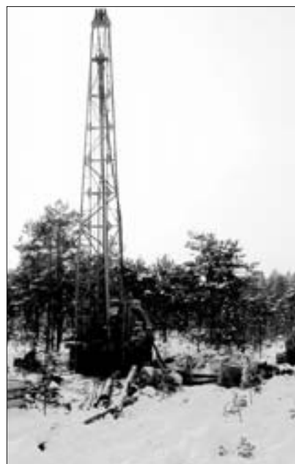
Puurturn pandi püsti just selles kohas, kus paekihit oli taevast tulnud kivi kukkumise tõttu murenenud.