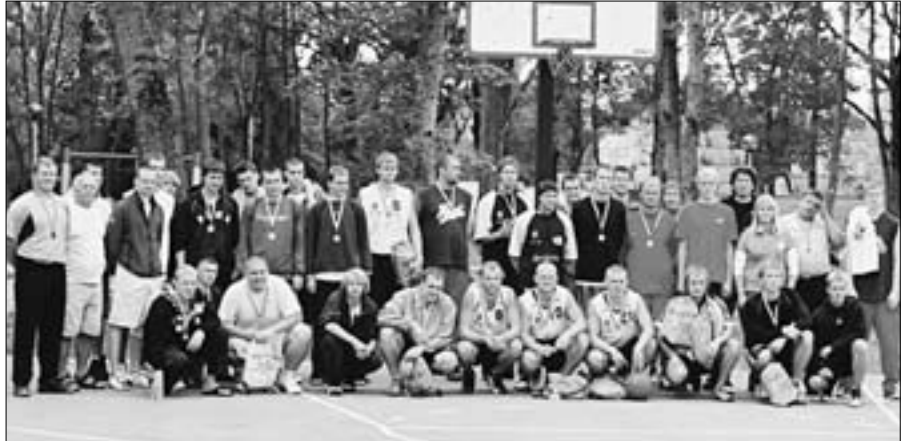
2. septembril toimus Jüri Kirikumõisa pargis traditsiooniks saanud korvpalliturniir, kus osalesid kaks Rae Kossu võistkonda ning Kiili ja Kose meeskonnad.

Lisaks on korvpalliklubil hea meel teatada, et algaval hooajal alustati noorte korvpallitree-