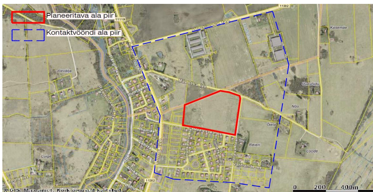
Joonis 1. Detailplaneeringu ala piir (punase raamjoonega) ja kontaktvööndi ala piir (sinise katkendjoonega)

Detailplaneeringu koostamise eesmärk on kooskõlas Rae Vallavolikogu 21.05.2013 otsusega nr 462 kehtestatud Rae valla üldplaneeringuga, kus planeeringuala maakasutuse juhtotstarbeks on määratud perspektiivne elamumaa.