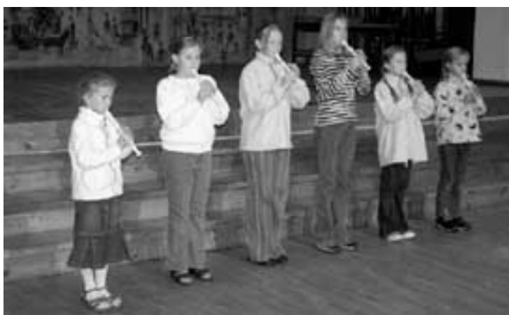
Esineb plokkflöödi ansambel