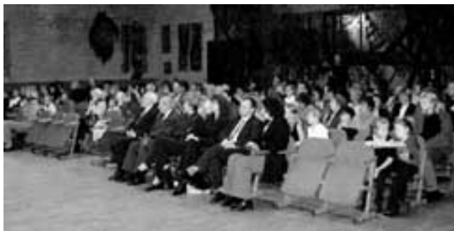
Kontserdile oli kogunenud palju kuulajaid-vaatajaid.