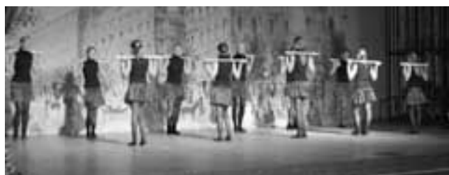
7. klassi tüdrukute liikumisrühm EXIT.