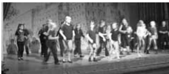
Tüdrukute liikumisrühm esitas tantsu "KUNG-FU".