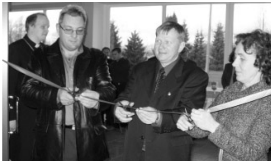
Söökla pidulikult avamisel lõikasid lindi läbi ehitaja, vallavalitsuse ja kooli esindaja.