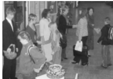
Sünnipäevahommikul andsid lastele tere- käte õpetajad ja koolidirektor.