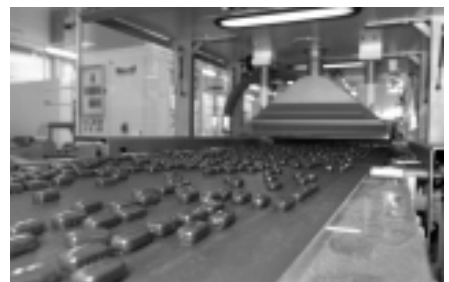
Šokolaadikommid saavad ilusa läike tänu sellele, et pruunide magusale massile on lisatud mesilasvaha.