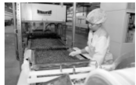
Kommivabrikus töötamine on töö, nagu iga teinegi. Ainult pisut magusam...