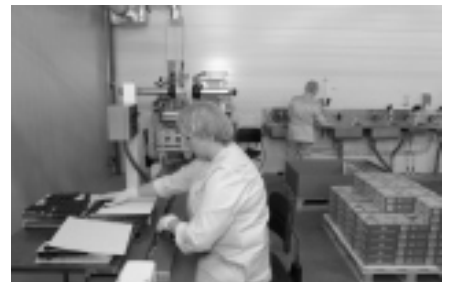
Batoonide pakkimine uues tootmistsehhis.

Detsembrikuus avatakse Kalevi kommivabriku olmekorpuse I korrusel tehase kauplus. Enam kui 80 ruutmeetrisesse poodi tuleb müügile Kalevi jõulutoodete täissortiment ning valik muid maiustusi.