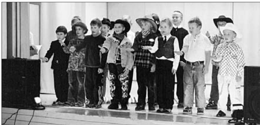
Lagedi poisid esinesid isadepäeva kontserdil suure uhkusega, tulevaste isade vääriiliselt.