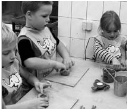
Savitükist tassi voolimiseks said nii poisid kui tüdrukud kiiresti hakkama, sest keraamikaringis käib nii mõnigi laps juba teist aastat.

Keraamikaringid töötavad Vaida koolis ja lasteaias alates oktoobrikuust. Selle aja jooksul on proovitud paljusid asju – tehtud on nii kauss, taldrik, päkapikususs, savist jõulukaart, küünlajalg. Valminud on ka ühistööd, kus iga laps teeb väiksema osa ja neist