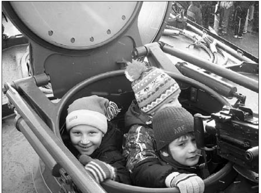
Üksik-sidepataljonis nägid 5-6aastased poisid nii pidulikke rivistust kui truuusetootuse andmist, eriti vahvana jäi aga meelde see, kui sai ise tutvuda sõjatehnikaga

Reedel, 11. novembril toimus aga sportlik Isadepäev. Pidu algas õues laste tühislaulude-