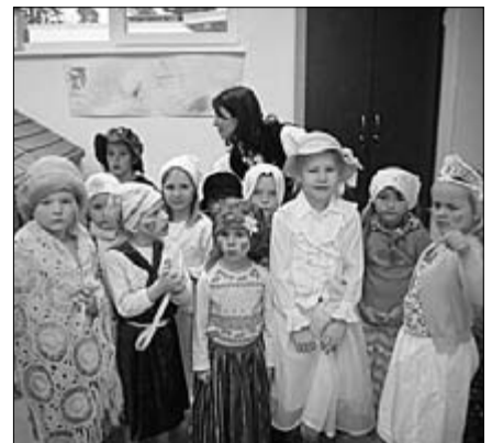
Pesamuna rühma lapsed olid maskeeritud te- gelaste ilmumisest pisut üllatunud, kuid elasid varsti nende tegemistele lustlikult kaasa.

Meeleolukaks kujunes Taaramäel ka Kad- ripäev. Paljud vanemad olid oma lapse kad- risandiks maskeerimist mõnusa fantaasiaga võtnud. Eriti ilmekad Kadrid tulid Kirsikese rühmast. Kolm vanemat rühma üllatasid kol- me nooremata rühma nende igapäeva tegemis- tes kadriõhtude ja -mängudega. Kuigi kõi- ge nooremata seas kadrisante algul vägagi