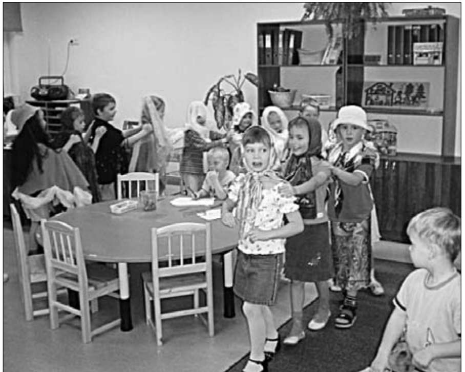
Kadrisantide ühislaulud ja -tantsud liitsid Taaramäe lasteaia erinevate rühmade lapsed kiiresti ühtseks pereks.

Sireli rühma lapsed olid kommivabriku siikolimisest saadik meisterdanud kommi- paberitest madu. Nüüd viisime selle 6-meet- rise ja kolme aasta vanuse sõbra „koju”. Loo- mulikult ei jätnud kommivabrik meid magu- saga kostitamast. Iga laps sai paki komme ja veel kamaluga pealekauba. Aga see pole pea- mine, miks meile Kalevis meeldis.