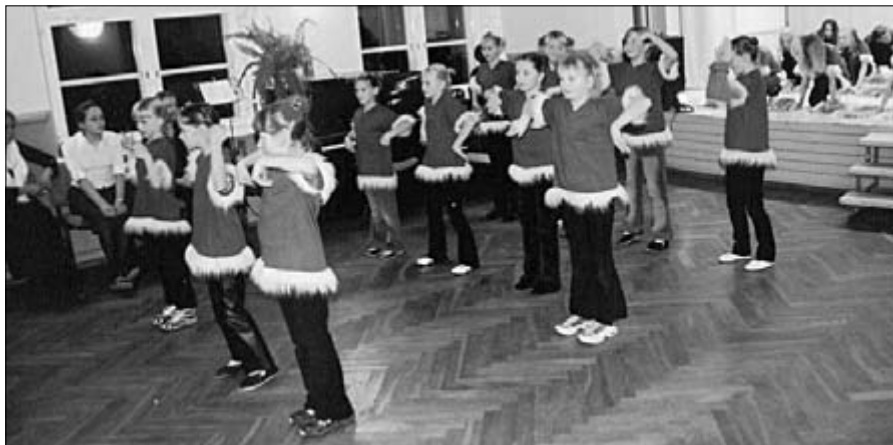
Tüdrukute showtants võlus vaatajaid nii erkaste kostüümide kui temperamentsete esinejatega.