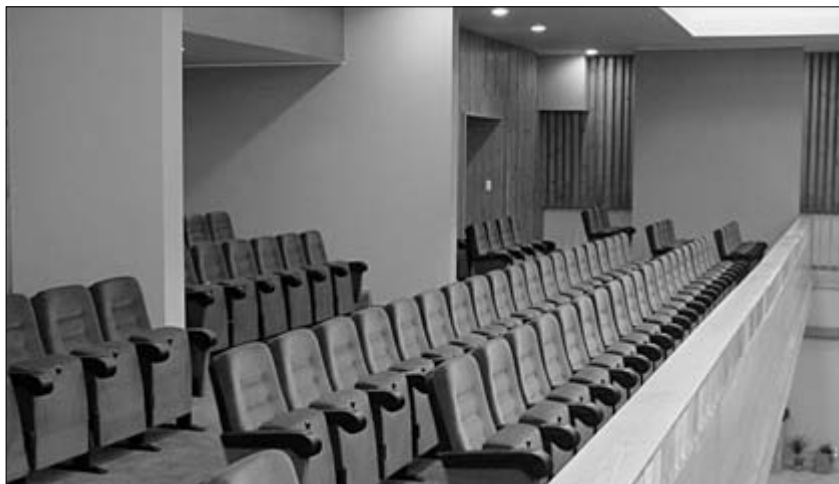
Tammeparketiga kaetud ja põrandasoojustusega saalis on nüüd ka 60-kohaline pehmete istmetega rõduosa.