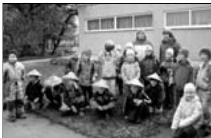
Sügispeo üllatused - kärbeseenete alla peidetud arbuusid, ootasid lapsi lasteaia õuel.

Kuidas selle põllumajandusega siis ikkagi on, seda käidi uudistamas Pihlaka talus: kui palju uhkeid ja vajalikke masinaid! Kui korras laudad! Väga armsad vasikad ja lehmad! Kui palju tööd nende kõikidega... Lapsed uudistasid sõna otseses mõttes suud lahti, populaarsemateks kohtadeks olid traktori- ja kombainikabiinid, kuhu lahke pererahvas ka lapsi turvaliselt aitas. Mõni poiss oleks sinna ehk tundideks jäänudki, ees seisis aga veel pal-