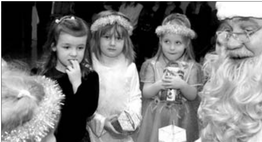
Lastealapsed saavad kommipakid lasteaia jõulupeol, koduseid lapsi oodatakse koolidesse ja kultuurikeskusesse.