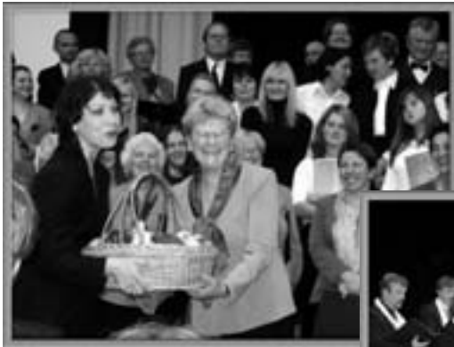
Jüri segakoor kui Jüri Muusika Seltsi järglane sai elujõu sümbolina kingituseks ka suure puuviljakorvi.