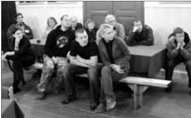
Rae valla loengusari on tuntust kogunud, seekordsete kuulajate hulgas oli palju külalisi ka väljastpoolt Rae valda.

Aarde leiukohast tulid päevavalgele ka kunagiste ehitiste jäänused. Eriti märkimisväärne on arvatavalt 12. sajandist pärinev savikummi-