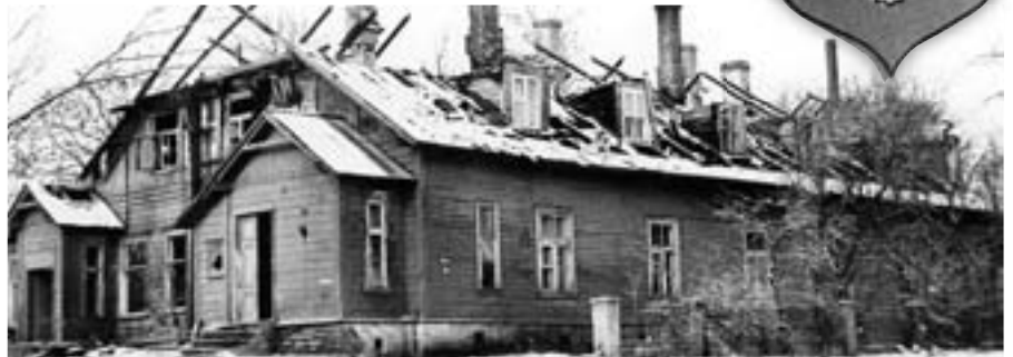
Arhitektuurimälestisena olnud Jüri pastoraadihoone lammutati 1988. aastal.

1986. aasta oktoobris tuli Jüri kiriku juures ja koolis kokku grupp muinsuskaitsehuvilisi, kellest valiti muinsuskaitse klubide eestseisus. Hiljem loodi üle kogu maa omaalgatuslikke ühendusi. Järgnes 1987. aastal Eesti Muinsuskaitse Seltsi loomine, mis oli laia kõlapinnaga ühiskondlik liikumine ning mis mängis suurt rolli iseseisvuse taastamisel ja inimeste teaduse kujundamisel omariiklusest kui ka rahvuslikust enesemääramisest.