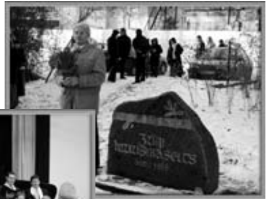
Juubelipäeva alustati piduliku kontsert-jumalateenistusega Jüri kirikus, seejärel tehti südamliek peatus muusikaseltsi mälestuskivi juures Jüris Metsa tänaval.