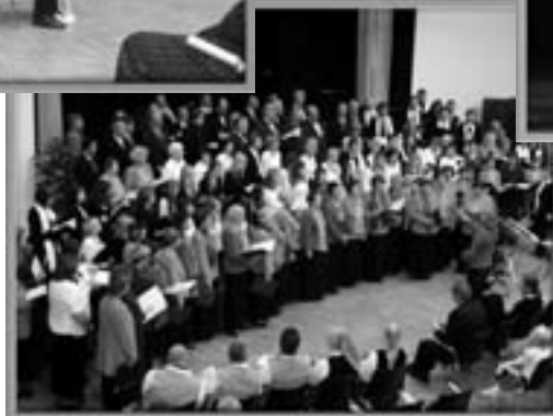
Muusika Seltsi suur sünnipäevakontsert algas ja lõppes võimsa ühendkooriga, üheskoos kinnitati ka, et laulud ei lõpe.