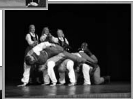
Segakoori sõbrad Salaspilsist esitasid hoogsaid ja rütmikaid Läti rahvatantse.