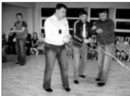
Isad tegid lastega kaasa kõik tantsud, mängud ja võistlused ning nii lustisid nii suured kui väikesed pidulised.

ju põnevat ja ka armas lasteaed ootas juba oma mudilasi õhtusöögil.