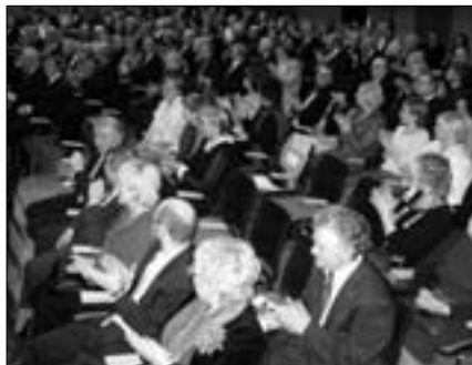
Pidulikult kontsert-aktusel esinesid valla isete- gevuslased nii laulude kui tantsunumbritega.

ningas jne), kuid on ka teada Vanast Kreekast roteeruva juhtimisega valitsemise süsteeme, milles linna juhtimine otsustati loosiga. Olid need süsteemid siis millised tahes – ühiseks ni- metajaks oli vajadus koordineerida kooselu.