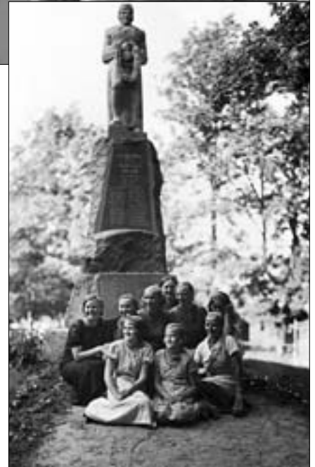
Jüri kirikaeda 26. septembril 1926 püstitatud mälestusmärk, millel kiri Au langenuile Eesti vabastamisel.

1949. aasta küüditamise järel said mälestussamba tükid peidetud kahes osas. Sõduriskulptuuri pea viisid kaitsekraavidest ära Part-