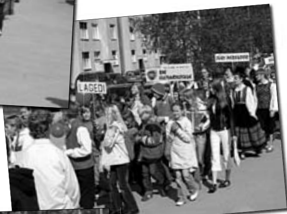
Rongkäigus oli kokku mitusada inimest, esindatud olid kõik lasteaiaid, koolid, koorid ja tantsuansamblid, ka külalistantsijad naabervaldadest.