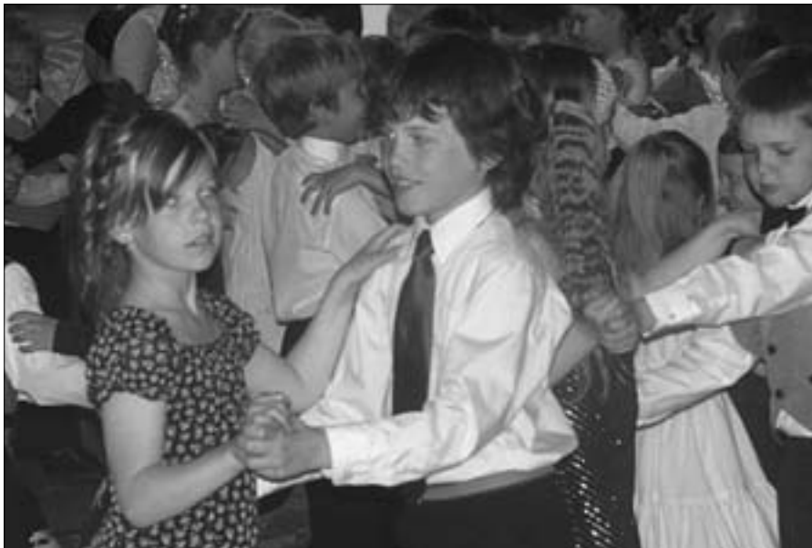
Kevadbaliil oli kõigil lastel võimalik ka emadele-isadele näidata, milliseid tantsu õpiti seltskonnatantsu tundides. Väärikalt ja kaunitult esitati nii avavalssi kui ka rocki.