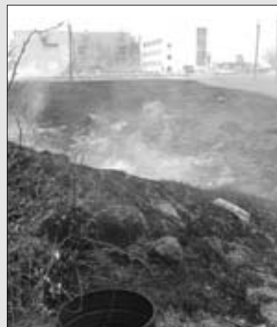
2. mai oli suur kulupõleng Jüri Gümnaasiumi juures.