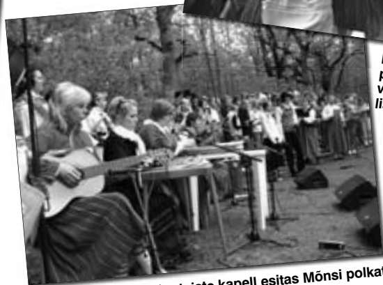
Jüri Gümnaasiumi õpetajate kapell esitas Mõnši polkat.