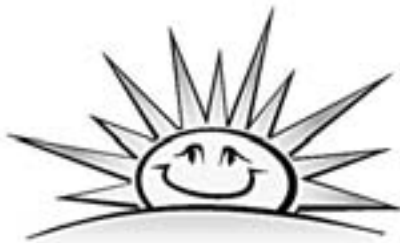
Otsime pesulasse töötajat!

Asume aadressil Aruküla tee 55A, autode tehnoloogiaareala kõrval.