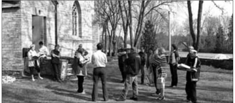
Talgupäevale oli kogunenud oodatust pisut vähem rahvast, kui loengud olid sellele vaatamata harivad ja huvitavad.

Kui kalmistut tervikuna hooldada ja püüda