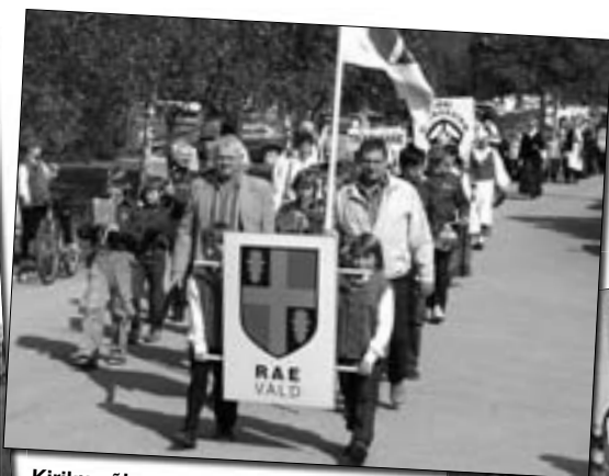
Kirikumõisa pargist alanud rongkäik kulgis peopaika Lehmja tammikusse.