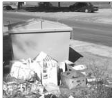
Isetekkinud prügilademed peaksid hiljemalt järgmiseks suveks olema kadunud. Prügimaja või -aedik on mõeldud ainult mahutitele.

Hoonetele, mis on ehitatud enne 1. jaanuarit 2006, kehtib üleminekupeerioid punktidest 83 ja 84 tulenevate kohustuste täitmiseks kuni 1. juulini 2007.