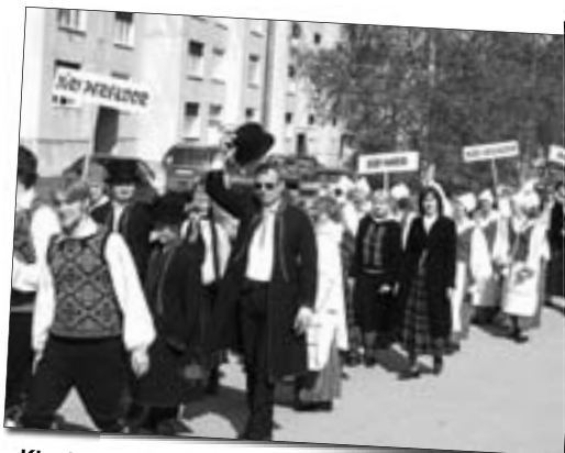
Klunker on kõikide pidu, rongkäigus aitas marsirütmi hoida Kose puhkpilliorkester. Pildil lehvivad Jüri perekoori lauljad.