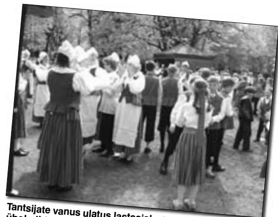
Tantsijate vanus ulatus lasteaialastest memmedeni, igaühel olid omad tantsunumbrid.