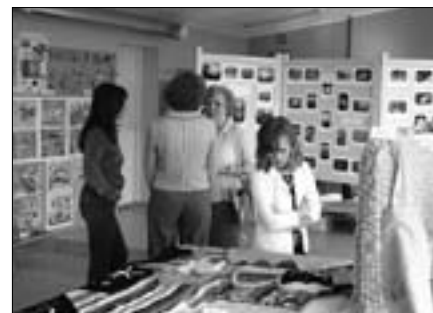
Käsitöönäitusel võis vaadata nii algklassilaste omaloomingut kui vanemate klasside õpilaste uurimustöid.