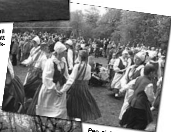
Peo ajal hakkas paistma ka päike, mis muutis Klunkerit veelgi rõõmsamaks ja tantsulisemaks.